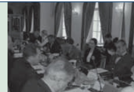
Vanaf 1 januari 2009 nemen de Tsjechen het voorzitterschap waar van de Unie. Het is de eerste keer dat de Tsjechen die klus moeten klaren. Dirk ging samen met een aantal liberale collega's naar Praag om er te praten met vertegenwoordigers van de Tsjechische Regering over hun plannen en prioriteiten voor de volgende zes maanden.